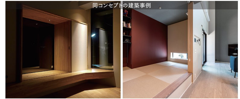
同コンセプトの建築事例