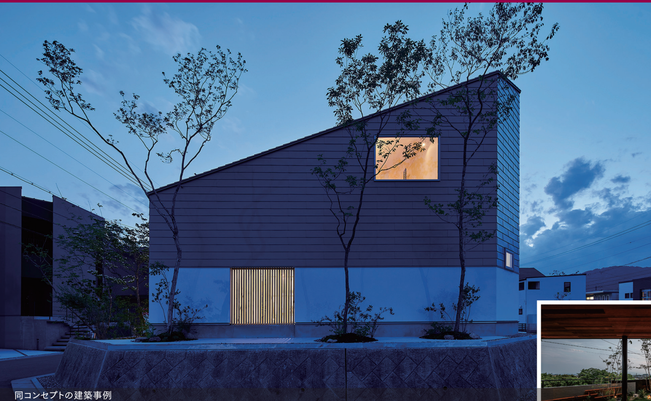
同コンセプトの建築事例